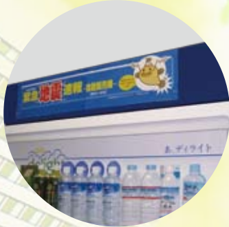
無線受信機外付型